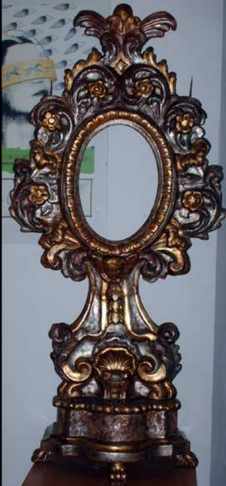
Ostensorio in legno e cartapesta, argento e argento meccato, 1700.